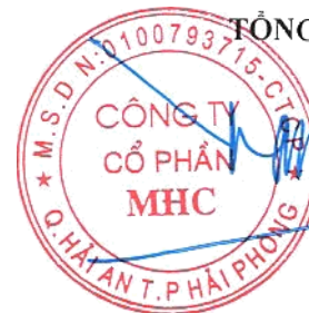
Đặng Tiến Thành